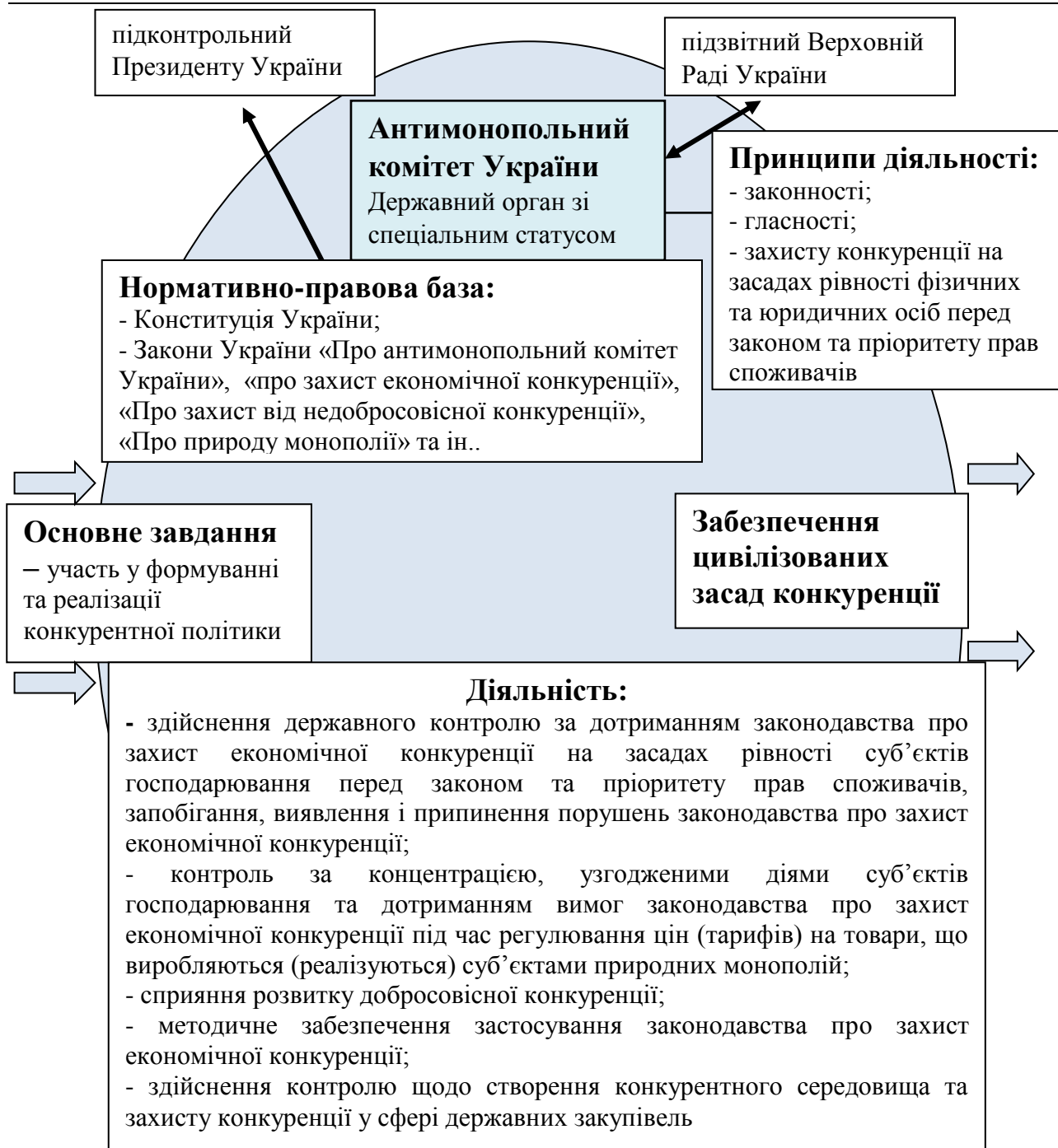
Рис. 1 Забезпечення державного захисту конкуренції антимонопольною діяльністю

Основним завданням Антимонопольного комітету України є участь у формуванні та реалізації конкурентної політики в частині [7]: