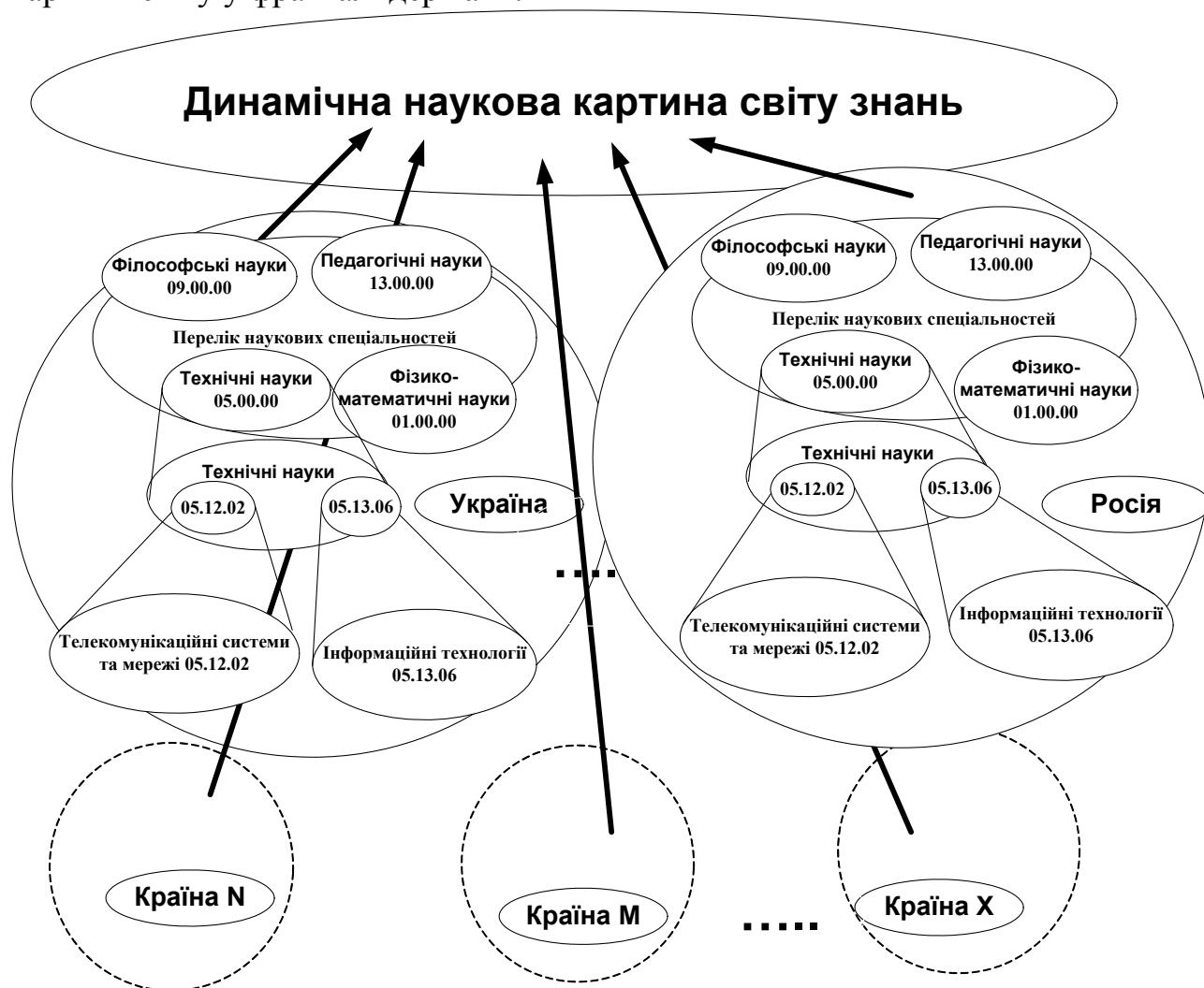
Рис. 2. Фрагмент фрактального повного уявлення про фрагмент наукової картини світу в частині, що стосується реального наукового пізнання вченими

дослідження (рис. 2). Опускаючись нижче до сукупності фрактальних систем підготовки НК НПК, ми отримаємо методологічну фрактальну модель наукового пізнання наукової картини світу в межах загальнодержавної на етапі підготовки НП НПК (дисертаційного дослідження), науковому пошуку в процесі професійної трудової діяльності (рис. 3). Отже, ця модель є і інформаційним каналом збагачення наукової картини світу у фракталі держави.