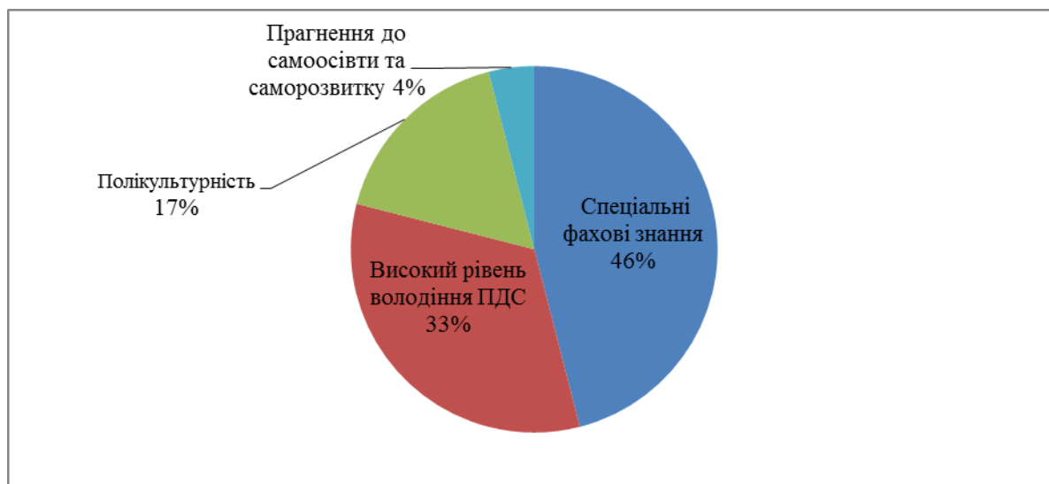
Рисунок 1. Схематичне відображення уявлень студентів щодо якостей фахівця.

Зважаючи на зазначене вище завдання, доречно проаналізувати уявлення студентів щодо образу сучасного конкурентоспроможного фахівця європейського рівня, яким вони прагнуть бути. Респондентам запропонували створити власну модель у довільній формі (у вигляді схеми, таблиці чи есе). Застосувавши метод узагальнення, ми фіксували ті ознаки та якості, які включали респонденти, вважаючи їх найбільш значимими. На цій основі розраховували відсоткове співвідношення кожного окремого складника, таким чином трансформуючи часткове в загальне. З метою образного відтворення уявлень опитуваних звернулись до кругової діаграми (Рис.1).